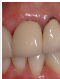
Vorher - mit Metall-Implantaten

Advertorial - Genussvoll und bedenkenlos essen zu können, das ist die wichtigste Anforderung an einen Zahnersatz. Dazu müssen Implantate gut sitzen, seien sie für Kronen, Brücken oder Prothesen, seien sie für alters- oder unfallbedingten Ersatz. Moderne Keramik-Zahnimplantate aus Zirkon garantieren perfekten Sitz. Zugleich bieten sie hohe Lebensqualität, weil die gesunden Zähne nicht beschliffen werden müssen und die Ersatzzähne natürlicher aussehen als Metallimplantate.