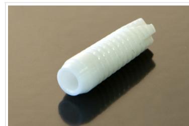
Zirkonimplantate sind besser verträglich und halten länger.