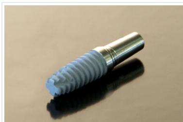
Metallimplantate sind den modernen Zirkonimplantaten unterlegen.