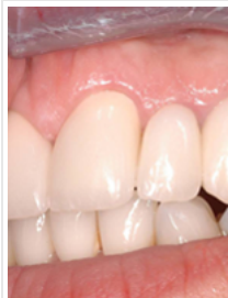
Nachher - mit Zirkonimplantaten

Beim Einzelzahnersatz hat eine Implantatlösung den Vorteil, dass keine gesunden Nachbarzähne beschliffen werden müssen. Dies verbessert die Langzeitprognose dieser Zähne erheblich. Implantatgestützte Brücken oder Prothesen gewährleisten eine bessere Kaufunktion. Zudem fühlen sich Patientinnen und Patienten damit sicherer, da sich ein solcher Zahnersatz wie eigene Zähne anfühlt. Mit dem Materialverträglichkeitstest vor Behandlungsbeginn, der begleitenden komplementärmedizinischen Diagnostik und den damit verbundenen entsprechenden Therapien, garantieren die Spezialisten vom Zentrum für Ganzheitliche Zahnmedizin für den Heilungsprozess und die knöcherne Stabilisierung des Implantates.